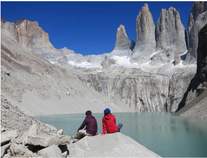
Gletschersee am Fuß der Torres del Paine