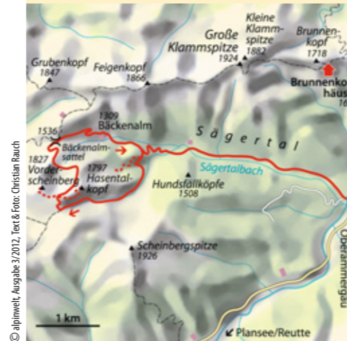
© alpinwelt, Ausgabe 3/2012, Text & Foto: Christian Rauch

ab München 1,5 Std. Bus & Bahn Bahn bis Oberammergau oder Oberau, Bus bis Linderhof, weiter zu Fuß Talort Linderhof, 943 m Schwierigkeit* Bergwanderung mittelschwer Kondition mittel Anforderung Teils schmale Steige, Abstecher ins Hasental weglos, am Hasentalkopf Schrofen (I) Ausrüstung kompl. Bergwandausrüstung Dauer 5–5,5 Std. Höhendifferenz ↗ 900 Hm