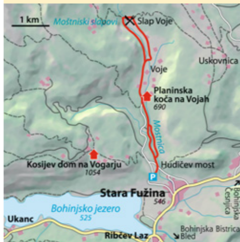
© alpinwelt, Ausgabe 3/2012, Text & Foto: Philipp Gruber

ab München 4 Std. Bus & Bahn Bahn nach Bohinjka Bistrica, Bus nach Stara Fužina (Dauer 7–9,5 Std.!) Talort Stara Fužina, 546 m Schwierigkeit* Bergwanderung leicht Kondition gering Anforderung kompl. Bergwandausrüstung, dazu evtl. Fotoapparat, Bestimmungsbuch, Badesachen Dauer reine Gehzeit 4 Std. Höhendifferenz ↗ 250 Hm Beste Zeit Mai–Juni