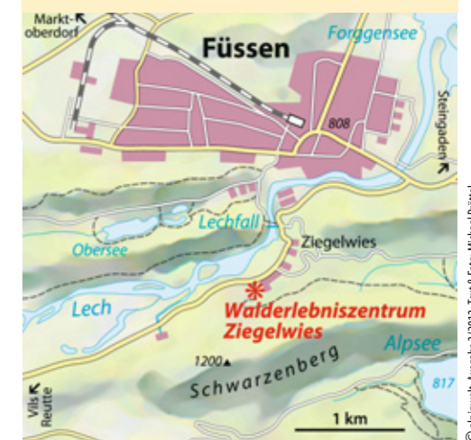
© alpinwelt, Ausgabe 3/2012, Text & Foto: Michael Prötel

ab München knapp 2 Std. Bus & Bahn Bahn nach Füssen, Bus bis Haltestelle Ziegelwies Talort Füssen, 808 m Schwierigkeit* Wanderung leicht Kondition gering Ausrüstung festes Schuhwerk Dauer Lehrpfade + Infozentrum + Holzpavillon insg. 5–6 Std. Höhendifferenz ↗ 150 Hm Info/Kontakt www.wez-ziegelwies.de