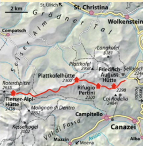
© alpinwelt, Ausgabe 3/2012, Text & Foto: Philipp Gruber

ab München 3,5 Std. Bus & Bahn Bahn über Brenner nach Waidbruck, Bus nach Wolkenstein, zu Fuß in 1,5 Std. aufs Sellajoch Talort Wolkenstein, 1567 m Schwierigkeit* Bergwanderung leicht Kondition gering Ausrüstung kompl. Bergwandausrüstung Dauer reine Gehzeit 4 Std. Höhendifferenz ↗ 200 Hm Beste Zeit Juni–Juli