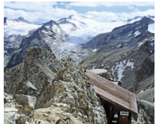
© alpinwelt, Ausgabe 3/2012, Text & Fotos: Maria und Wolfgang Rosenwirth

* alpinwelt-Schwierigkeitsbewertungen: www.schwierigkeitsbewertung.alpinprogramm.de