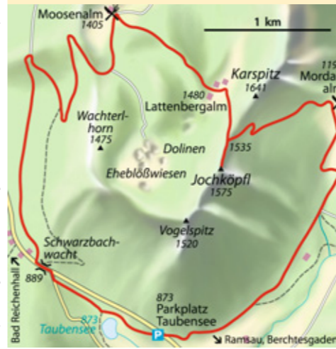
© alpinwelt, Ausgabe 3/2012, Text: Berchtesgadener Land Tourismus GmbH und Redaktion alpinwelt, Foto: Franz Renoth

ab München 2 Std. Bus & Bahn Bahn bis Berchtesgaden, Bus bis Taubensee Talort Ramsau bei Berchtesgaden, 670 m Schwierigkeit* Bergwanderung mittelschwer Kondition gering Anforderung aufgrund von einigen Steigungsabschnitten eine gewisse Trittsicherheit Ausrüstung kompl. Bergwandausrüstung Dauer 4–5 Std. Höhendifferenz ↗ 660 Hm