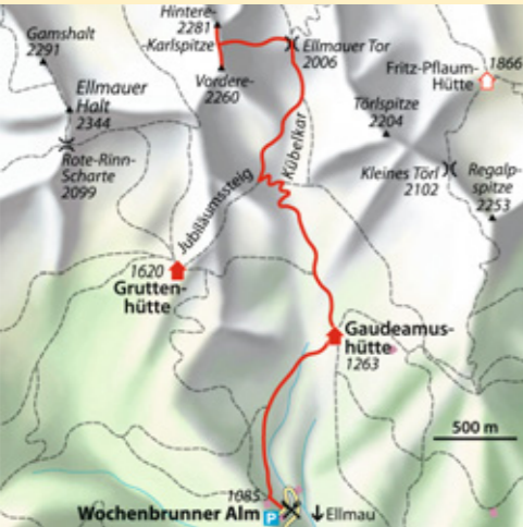
© alpinwelt, Ausgabe 3/2012, Text & Foto: Franziska Leitner

ab München 1,5 Std. Bus & Bahn Bahn bis Wörgl, Bus bis Ellmau Dorf Talort Ellmau, 804 m Schwierigkeit* Bergtour Kondition mittel Anforderung Trittsicherheit und Schwindelfreiheit unbedingt erforderlich, stellenweise Kletterei bis II. Grad Ausrüstung kompl. Bergwandausrüstung, wegen Steinschlaggefahr Helm Dauer ↗ 6–7 Std. Höhendifferenz ↗ 1200 m