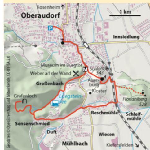
© alpinwelt, Ausgabe 3/2012, Text & Foto: Christian Rauch

ab München 1 Std. Bus & Bahn Bahn nach Oberaudorf, zu Fuß ins Ortszentrum Talort Oberaudorf, 482 m Schwierigkeit* Wanderung leicht, optional eine schwierige Stelle am Grafenloch Kondition gering Anforderung Am Grafenloch auf den letzten Metern ausgesetzte Leiter mit Drahtseil Ausrüstung kompl. Bergwandausrüstung Dauer 2,5–3 Std. Höhendifferenz ↗ 300 Hm