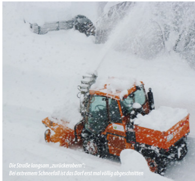
Die Straße langsam „zurückerobern“: Bei extremem Schneefall ist das Dorf erst mal völlig abgeschnitten