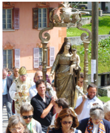
Prozession im Rahmen des Dorffestes am 15. August zu Ehren der heiligen Maria