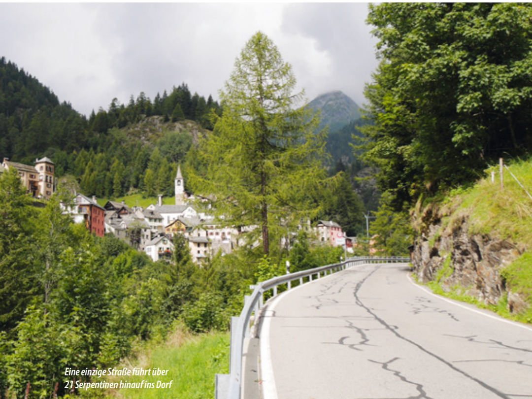
Eine einzige Straße führt über 21 Serpentinaen hinauf ins Dorf