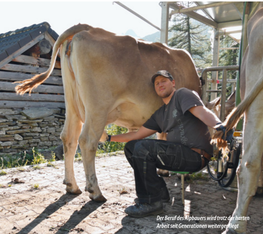
Der Beruf des Alpbauers wird trotz der harten Arbeit seit Generationen weitergepflegt