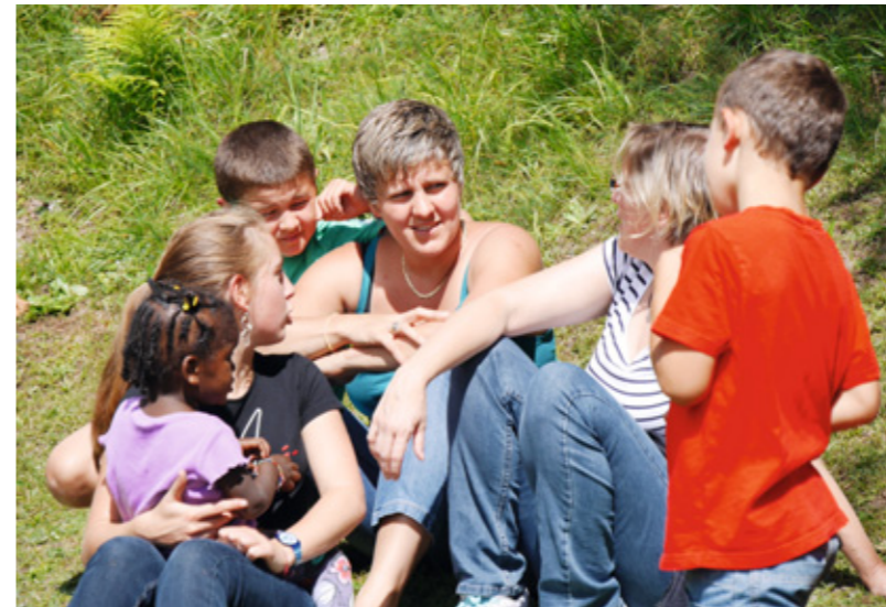
In Fusio aufwachsen bedeutet oft Verzicht, dafür aber eine intensive Beziehung zu Tier und Natur

Dafür hat Fusio einiges an Festen zu bieten. Nach dem „Skizirkus“ mit großer Tombola am Dreikönigstag sowie an „Carnevale“ mit