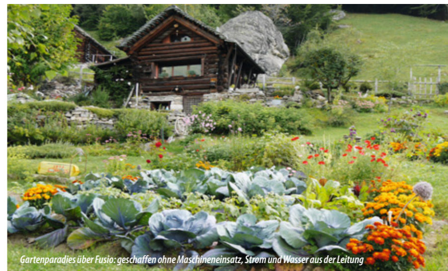
Gartenparadies über Fusio: geschaffen ohne Maschineneinsatz, Strom und Wasser aus der Leitung

Nein! Da, wo ich gehe, ist es wild – und das ist schön so. Aber es kommen schon einige Touristen, weil Fusio ein Zentrum für diverse Bergziele ist. Ich finde, man erkennt die Leute, die in die Berge gehen: Die, die schlecht gelaunt zurückkommen, haben auch keinen sehr guten Charakter.