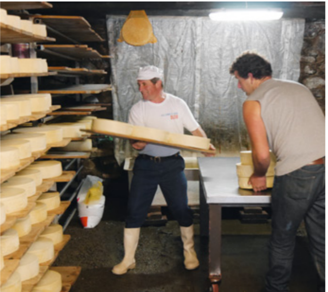
Beide Bauern in Fusio produzieren die lokale Spezialität: den Formaggio Vallemaggia