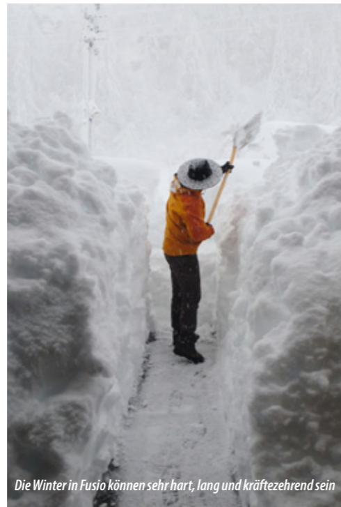
Die Winter in Fusio können sehr hart, lang und kräftezehrend sein

Es geht also auch ohne Strom (zumindest eine Zeitlang, und die Bauern haben Generatoren) – aber nicht ohne Holz! Kein Haus, vor dem sich davon nicht reichlich stapelt. Es liegt ja auch gewissermaßen direkt vor der Haustür. Und: „Es wird immer mehr“, sagen